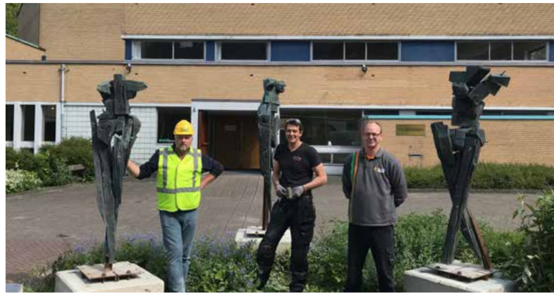
Installatie van de bronzen sculpturen bij de Thomaskerk voor ArtZuid 2021