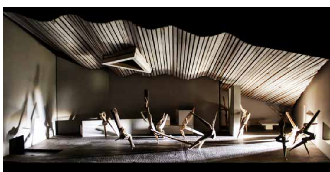
Boven: Studie Choreografie + Licht reagerend op ruimte Thomaskerk | Onder: Impressie sculptuur