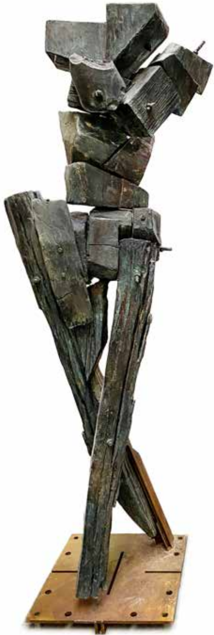
NAME DANCERS FROM OBLIVION | I MEASUREMENTS 210 x 50 x 50 cm