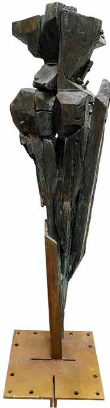
NAME DANCERS FROM OBLIVION | II MEASUREMENTS 200 x 50 x 50 cm