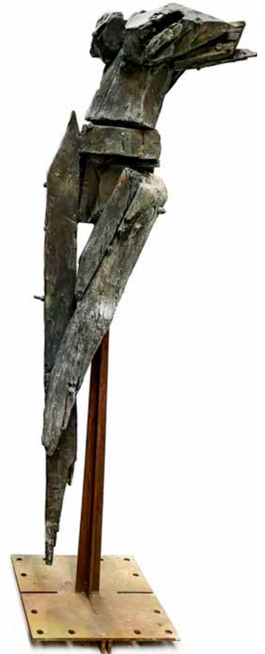
NAME DANCERS FROM OBLIVION | III MEASUREMENTS 210 x 50 x 50 cm